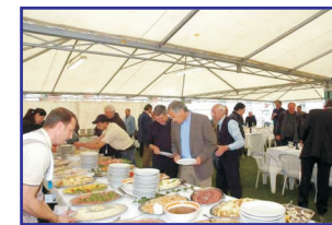
MOMENTO DEL PRANZO